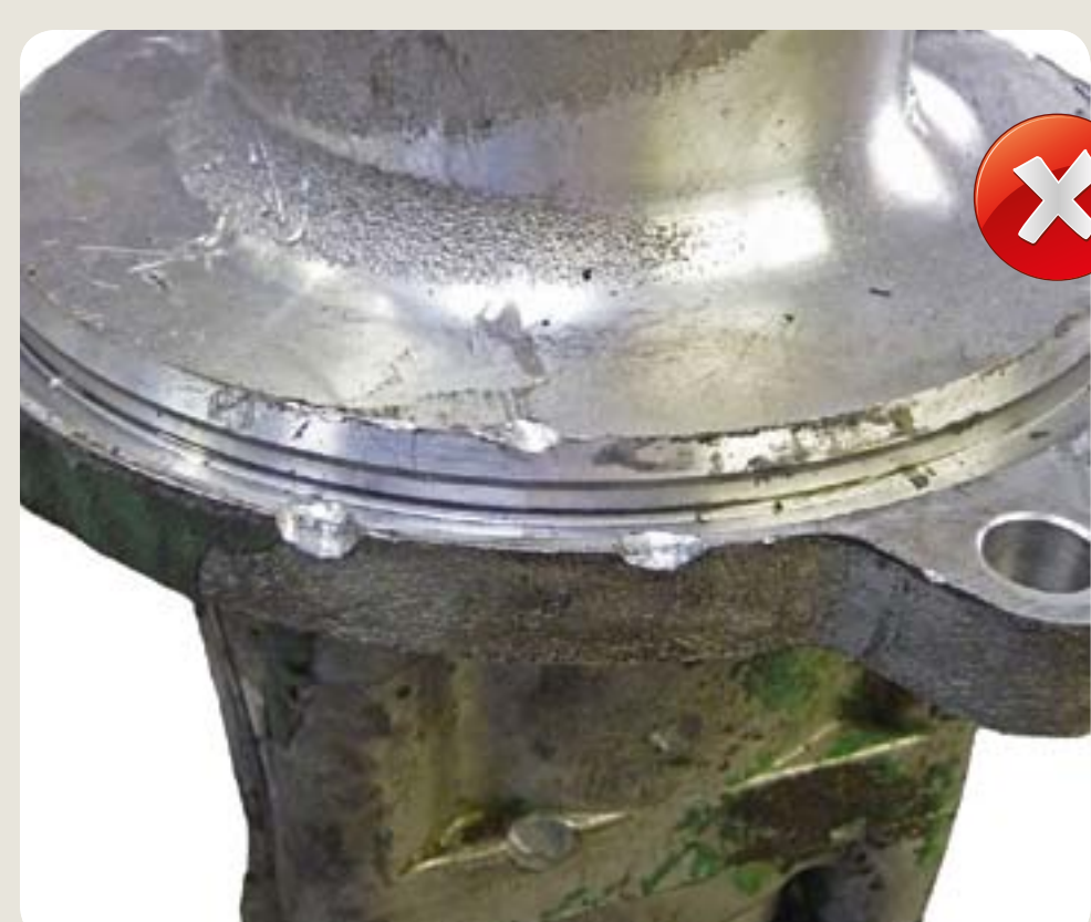
poškozené těleso poškození vzniklá při demontáži