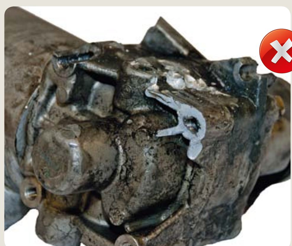
ulomený úchyt poškození vzniklá při manipulaci