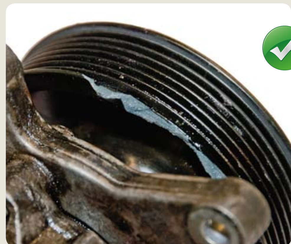
řemenice lehce poškozená