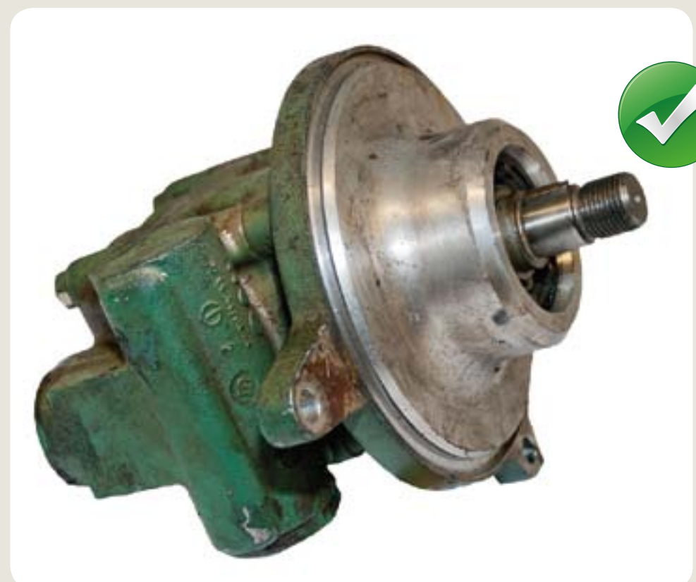
čerpadlo nepoškozeno málo rzi