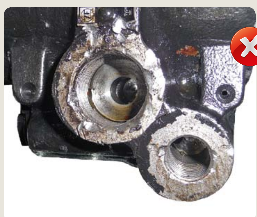
poškozený závit poškození vzniklá při demontáži